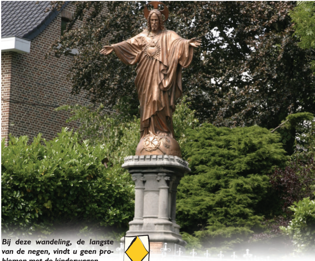
Bij deze wandeling, de langste van de negen, vindt u geen problemen met de kinderwagen.